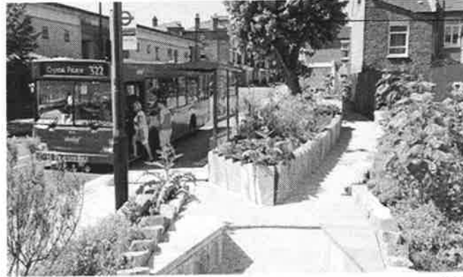
Imagen de publicación de Página electrónica TWENWRGY