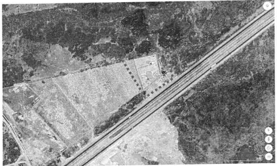
Fotografía aérea Kilómetro 170 + 500 (Libramiento Guadalajara- Zapotlanejo) sin número.

LOCALIZACIÓN. Kilómetro 170 + 500 (Libramiento Guadalajara- Zapotlanejo) sin número; a 1,120.00 metros al poniente de la calle 5 de Mayo, entre ésta y la Carretera Libre a Zapotlanejo, Colonia Puente Grande correspondiente al Plan de Desarrollo Urbano de Centro de Población, Distrito Urbano TON-14 "Mismaloya", 5,974.00 m 2 aproximadamente: