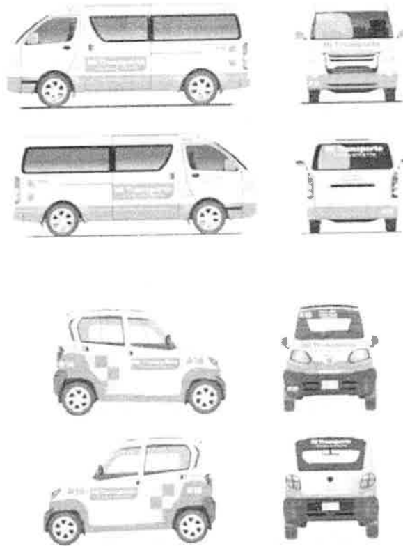
Imagen 3: Transporte Comunitario expuesto en la Norma Técnica publicada por la Secretaría de Gobierno en 2023.

Ante la tentativa de las autoridades por incluir a los mototaxis bajo la figura de transporte comunitario, y con ello, hacerlos cambiar sus vehículos por modelos de 4 ruedas, el gremio de mototaxistas ha manifestado su desacuerdo. Conforme a lo documentado en medios de comunicación, particularmente en la cobertura de Pablo Toledo (2024) para UDGTV, por una parte, los mototaxistas han externado preocupaciones relacionadas con la viabilidad económica de la medida. Las unidades propuestas en la Norma Técnica antes citada tienen un costo de 160 mil pesos, lo que resulta inaccesible para las personas operadoras de mototaxis ya que es una inversión que pondría en riesgo el sustento de sus familias. Por otra parte, el gremio de mototaxistas sostiene que estos vehículos de pequeña escala y 4 ruedas no representan una mejora sustancial en materia de seguridad, por lo que consideran injustificada la imposición del cambio. En ese sentido, expresan su disposición a que su actividad sea regulada y así cumplir con requisitos como licencias, cursos o medidas de seguridad, pero rechazan la sustitución obligatoria de