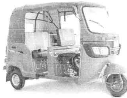
Imagen 1: Modelo tradicional de mototaxi bajo la figura de “transporte público especializado”.

tres ruedas y con techo que se utiliza para el transporte de pasajeros, se ha desarrollado principalmente en zonas donde existe una alta demanda de viajes cortos, donde el transporte público convencional presenta limitaciones en su cobertura geográfica y temporal, o donde las condiciones físicas del territorio dificultan el acceso de unidades de mayor tamaño 7 .